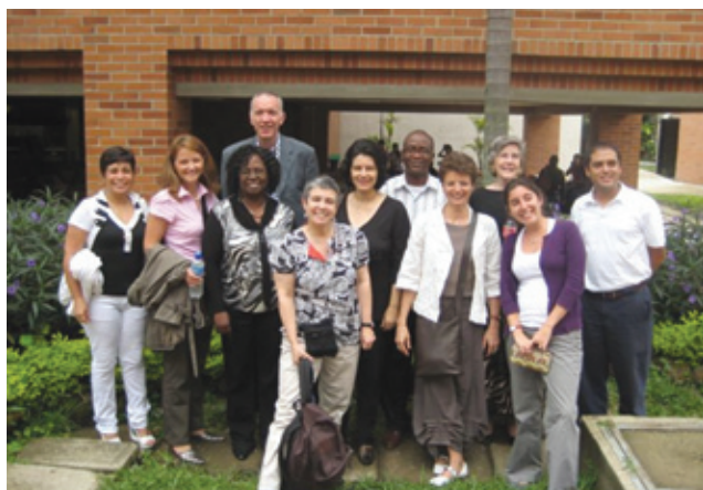
Figura 1. Participantes de la Reunión de la Red de Centros de Referencia para Capacitación en Cursos de Planeación y Evaluación Efectivas de Proyectos, Cali, Colombia, abril 26-28, 2010.

El Curso de Habilidades PEEP tiene como objetivo fortalecer las habilidades de los investigadores para la salud de países en vías de desarrollo para que alcancen con éxito la implementación de sus proyectos y el establecimiento de colaboraciones, y que estén bien posicionados para competir internacionalmente en la elaboración de propuestas de investigación. El curso proporciona las herramientas necesarias para la planeación y evaluación de proyectos y se dicta usualmente en 4 días (32 horas). La metodología del curso es la de “aprender haciendo”, por lo tanto los participantes trabajan en grupos de tres personas y al final del curso han logrado avanzar significativamente la planificación de su proyecto. Cada grupo trabaja con su propio proyecto durante un 80% del tiempo del curso lo que les permite a los participantes aplicar los pasos de planeación y evaluación a su proyecto. El Curso se desarrolla a través de cinco módulos (ver Figura 2): Buenas prácticas en la investigación para la salud (teoría), Entender el concepto y valor de la planeación y evaluación de proyectos (teoría), Definir el propósito y alcance del proyecto (Fase 1, teoría y estudio de casos), Establecer el plan de desarrollo del proyecto (Fase 2, teoría y estudio de casos) y Ejecución, supervisión, evaluación y reporte (Fase 3, teoría y estudio de