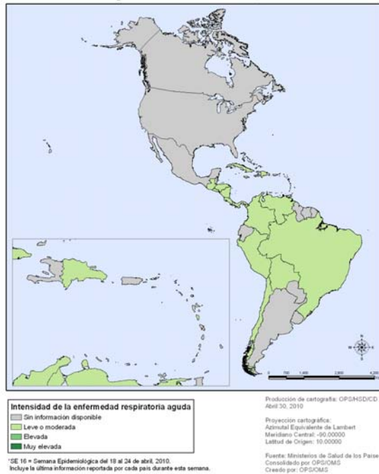
Mapa 3. Pandemia (H1N1) 2009, Intensidad de la enfermedad respiratoria aguda en la población. Región de las Américas. SE 16, 2010*.