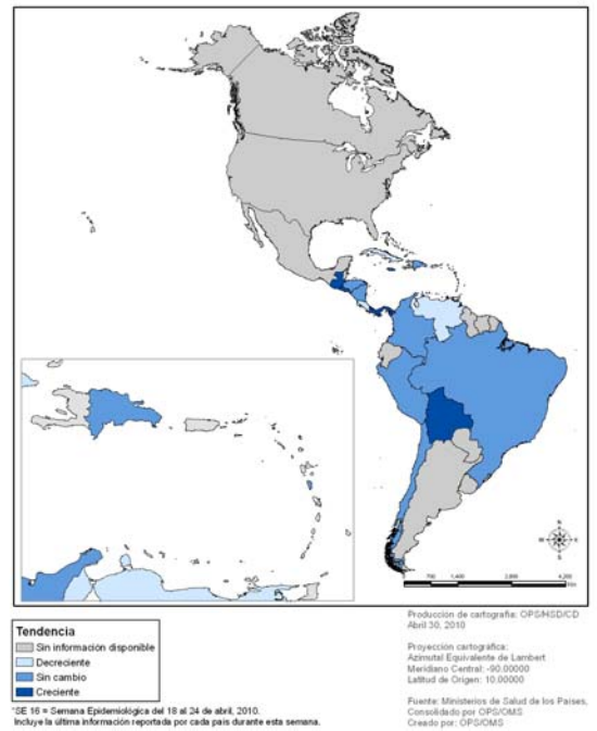
Mapa 2. Pandemia (H1N1) 2009, Tendencia del nivel de actividad respiratoria comparado a la semana previa. Región de las Américas. SE 16, 2010*.